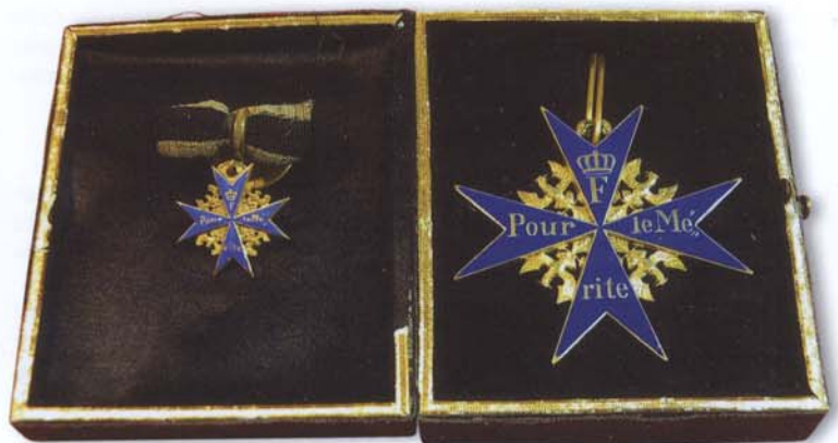
Abb. 3a: Der preußische Militärorden „Pour le Mérite“ zusammen mit der Miniatur im Verleihungsetui, Vorderseiten.