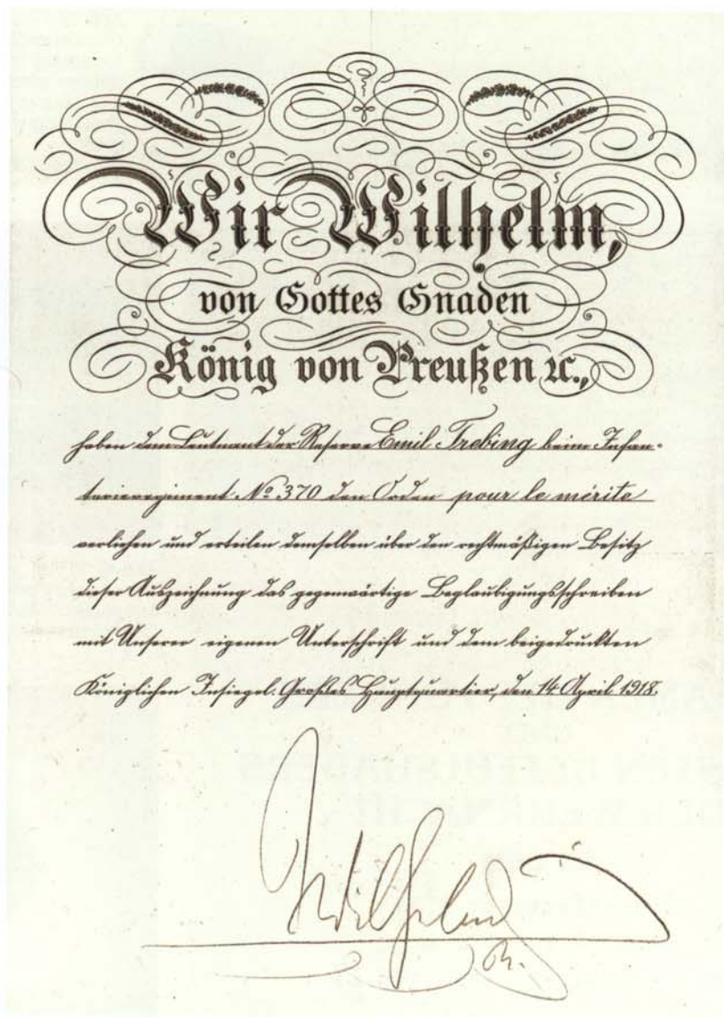
Abb. 3d: Verleihungsurkunde zum Orden „Pour le Mérite“.