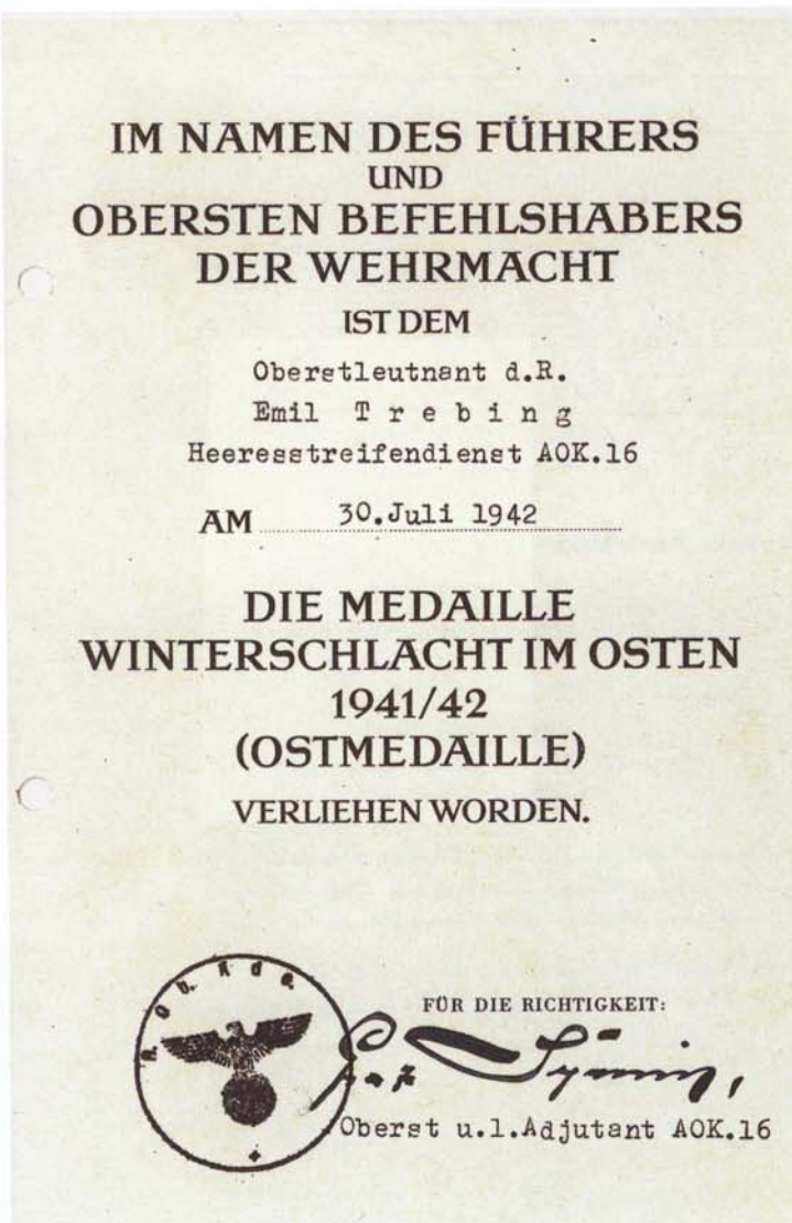
Abb. 5: Verleihungsurkunde zur Medaille Winterschlacht im Osten 1941/42 (Ostmedaille).