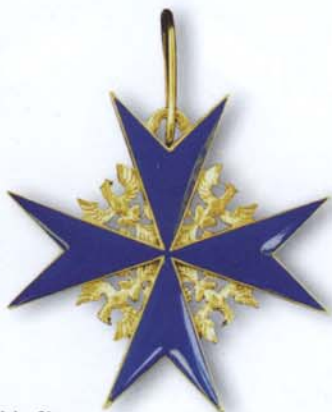
Abb. 3b: Rückseite des „Pour le Mérite“.

Am 2. September 1935 wurde Trebing als Oberleutnant d.R. und Bataillonsführer zur Infanterieschule nach Döberitz berufen, am 9. März 1936 erfolgte seine Versetzung als Bataillonsführer zum Infanterie-Regiment 15 nach Kassel. Seine Beförderung zum Major - unter Überspringung des Hauptmanns-Dienstgrades - erfolgte am 9. April 1937. Den Beginn des Zweiten Weltkrieges erlebte er im Infanterie-Regiment 163 mit Stellungskämpfen im Abschnitt Saarbrücken bis zur Maginotlinie, später war er beim Küstenschutz am Ärmelkanal eingesetzt. Mit Beginn des Feldzuges gegen die Sowjetunion wurde er im AOK 16 im Heeresstreifen dienst des Infanterie-Regiments 15 eingesetzt; am 1. April 1941 wurde er zum Oberstleutnant z.V. befördert. Seine Beförderung zum Oberst erfolgte am 1. Oktober 1943, am 4. August 1944 wurde er bei einem Nachtgefecht durch Granatsplitter schwerst verwundet. Nach seiner Verbringung in das Militärhospital Marburg erlag er dort am 6. Oktober 1944 seiner Verwundung. Sämtliche Orden, Ehrenzeichen und Effekten wurden damals an seine Familie geschickt, lediglich das durchgeblutete Ordensband des Pour le Mérite war nicht dabei. So endete eine bemerkenswerte Soldatenlaufbahn.