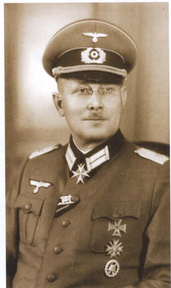
Abb. 6: Trebing als Oberleutnant der Wehrmacht mit dem Pour le Mérite, dem EK I 1914, dem EK II 1914 mit Wiederholungsspange 1939, dem KVK I. Klasse mit Schwertern und dem Verwundetenabzeichen 1918 in mattweiß (er hat das ihm verliehene Original gegen ein durchbrochenes Exemplar ausgetauscht).