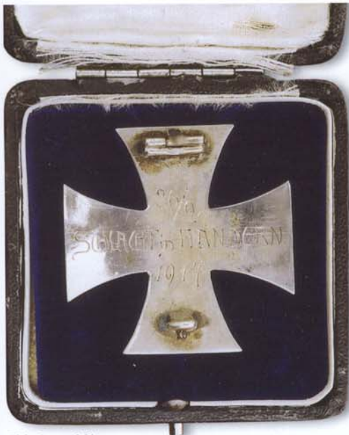
Abb. 1a und 1b: Eisernes Kreuz I Klasse 1914 mit privater rückseitiger Widmung „26/9. / SCHLACHT IN FLANDERN / 1917“.