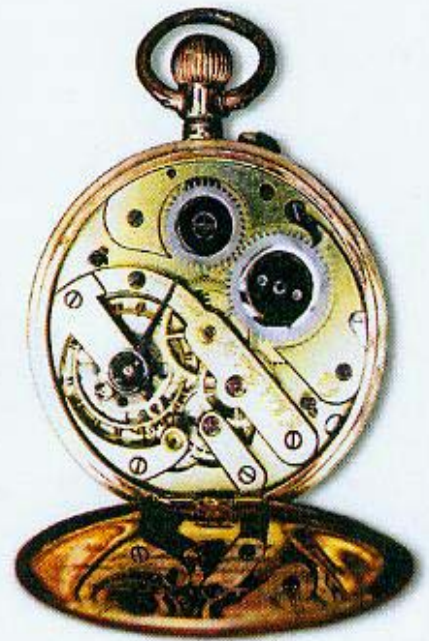
Abb. 5: Gravur des Hoflieferanten „C. Jupitz, Berlin W“ im Uhrwerk.