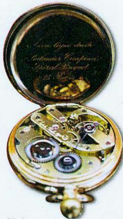
Abb. 4: Herstellergravur der Firma Breguet im Uhrdeckel.