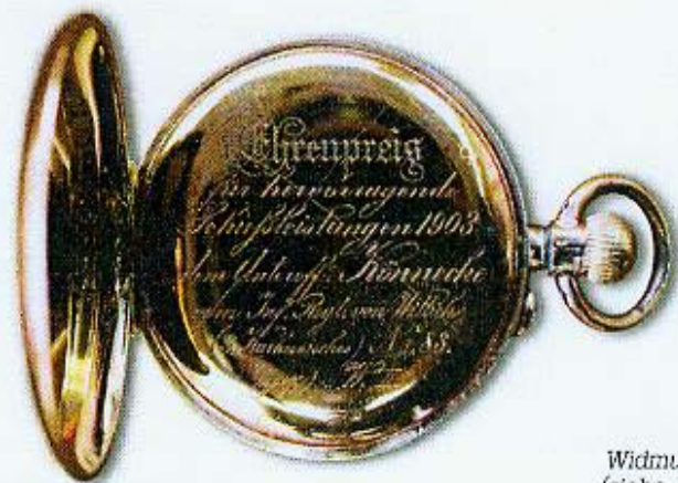
Abb. 3: Widmungsgravur (siehe Artikeltext).

In meinem Besitz befindet sich eine auf den ersten Blick recht unscheinbare Taschenuhr (Abb. 1), die ich zusammen mit einigen Militaria-Objekten aus einem Nachlass erworben habe. Zunächst widmete ich dieser Uhr kaum Beachtung, da mein Hauptinteresse der zugehörigen Großen Ordensspange (Abb. 2) galt. Erst später entdeckte ich nach der Reinigung der Uhr mehrere Gravuren in den Uhrdeckeln. Zu meiner großen Freude stellte sich heraus, dass diese Uhr vom Deutschen Kaiser und König von Preußen, Wilhelm II., als Ehrengeschenk für besondere Schießleistungen vergeben worden war. Die entsprechende Gravur (Abb. 3) lautet: Ehrenpreis für hervorragende/Schießleistungen 1903/ dem Unteroff. Könnicke/vom Inf. Regt. von Wittich/(3. Kurhessisches) Nr. 83./(gez.) W. II.